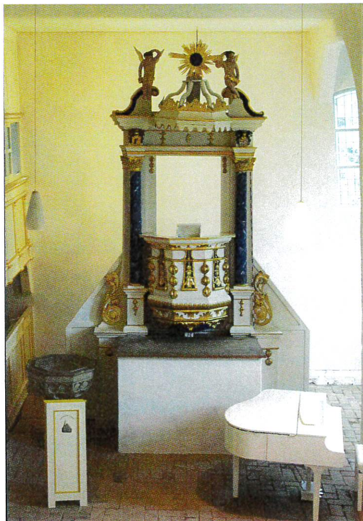
Kulturkirche Landin im Herbst 2021

Kirchen Berlin-Brandenburg e.V. Neben dem Preisgeld bedeutete die Zuerkennung für uns vor allem, dass Insider und Fachleute an uns und unser Projekt glaubten. Das beflügelte uns sehr. Auch in den Folgejahren begleitete uns der Förderkreis immer wieder mit Rat und Tat.