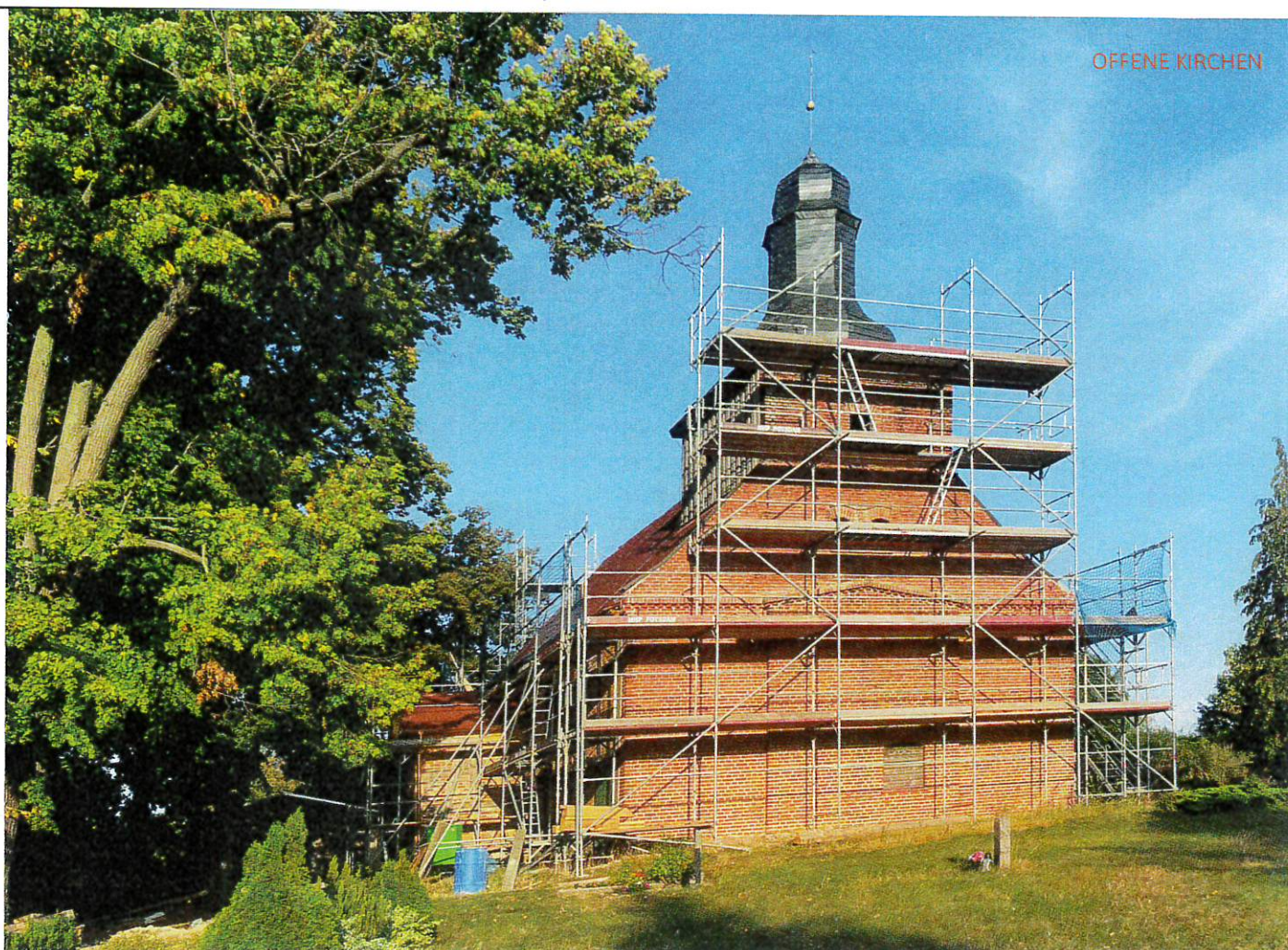
Die Landiner Patronatskirche während der Sanierung 2019